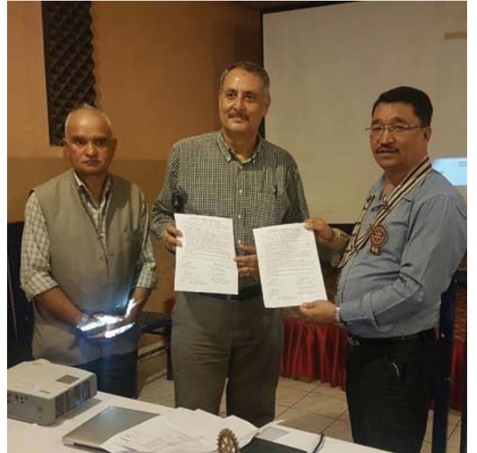
MoU signed with Helping Society Nepal

(थौया मुँज्याय् दीपिं जःपिं १७म्ह, आयन ४म्ह, रोटराक्टर २म्ह, पाहाँ रोटेरीयन ३म्ह, जम्मा २९म्ह । सनसाइन १५०० तका)